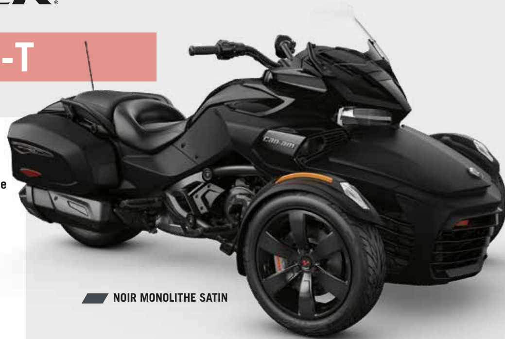
NOIR MONOLITHE SATIN